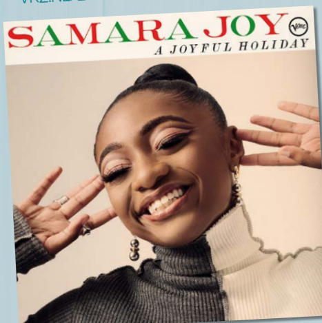
A JOYFUL HOLIDAY SAMARA JOY UNIVERSAL 0602458285680 VKZ.NL/230506060 € 18,99