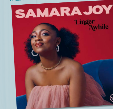
LINGER AWHILE SAMARA JOY UNIVERSAL 0602448266491 VKZ.NL/230506061 € 9,99