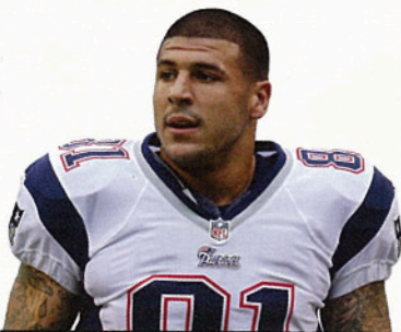
OJ SIMPSON 2.0

Waarom pleegde NFL-ster Aaron Hernandez zelf-