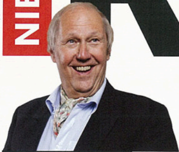
JOEPIE DE POEPIE

Edwin Rutten: 'De grootste criminelen worden kleine jongetjes bij mij'